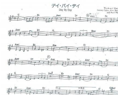
第63回プレイヤーオーディション課題曲 2021年9月20日