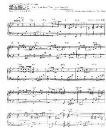
第63回プレイヤーオーディション課題曲